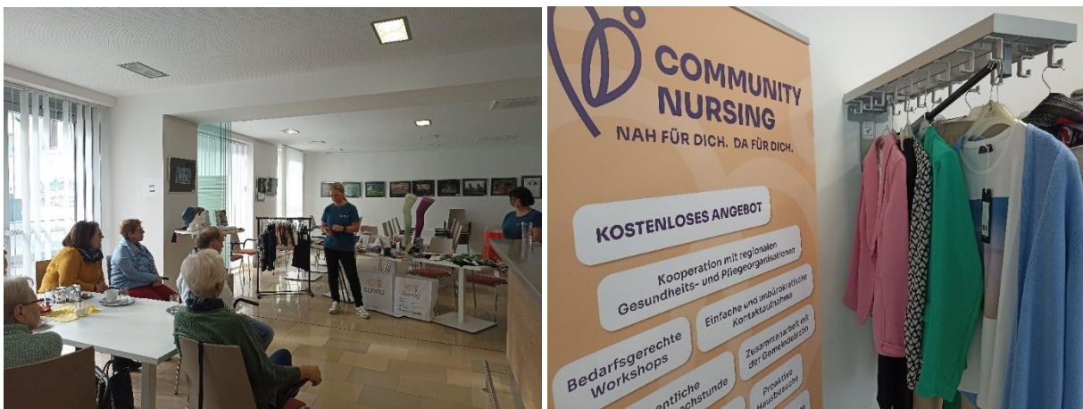
Abbildung 4 und 5: Community-Plauder-Café: Motto „Mode im Alter – Tipps und Tricks“

Das CPC richtet sich an die Zielgruppe der älteren Menschen ab 65 Jahren, es wird jedoch von einigen jüngeren Dorfbewohnerinnen und Dorfbewohnern ebenso genutzt. Die praxisnahen Fachvorträge anhand der AEBDL haben zum Ziel, die Alltagskompetenz der älteren Generation und ihre Ressourcen zu stärken, z. B. wurden unter dem Motto „Mode im Alter – Tipps und Tricks“ in Kooperation mit einem regionalen Modegeschäft und einem Bandagisten Anziehhilfen und leicht anziehbare Mode vorgeführt. Eine gegenseitige Unterstützung der Generationen wird durch den Besuch der Kindergartenkinder ermöglicht, zur AEBDL „sich beschäftigen können“ werden z. B. im Mai 2024 verschiedene Techniken des Handarbeitens geübt (vgl. Engel, R., 2020, S. 49).