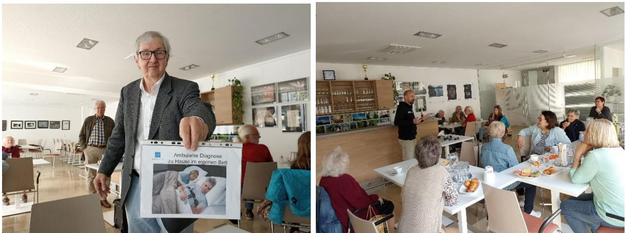
Abbildung 2 und 3: Community-Plauder-Café: Motto „Schnarchen – was tun?“