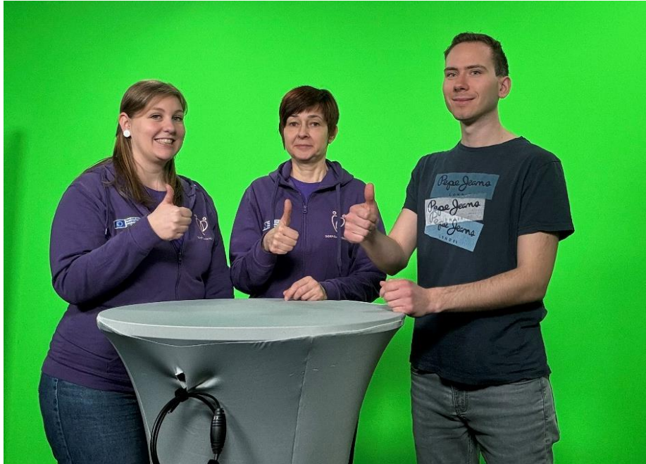
Abbildung 3: CN mit Mediacenter-Mitarbeiter im Green Room