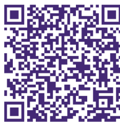
Abbildung 4: QR-Code für die Videoclip-Reihe des CN-Netzwerks Burgenland

Im Burgenland haben sich alle sechs CN-Pilotregionen zu einem Netzwerk zusammengefunden, pro CN-Team sind drei Clipaufnahmen bis zum Ende der Projektlaufzeit geplant. Bis dato wurden neun Clips produziert, zwei weitere befinden sich in Fertigstellung. Diese sind auf einem Youtube-Channel unter „Community Nursing Video-Clipreihe“ abrufbar (Fachhochschule Burgenland b ), ein schneller Zugriff ist mittels QR-Codes möglich (siehe Abbildung 4). Die Verbreitung der erstellten Videoclips geht damit über die Pilotregionen hinaus und verdeutlicht das Bestreben, Wissen zu vermitteln und Informationen zu teilen und somit einen breiteren Einfluss auf die Gesundheitsversorgung der Gesamtbevölkerung zu haben. Die CN fungieren in diesem Kontext als Agents of Change , sprich als Veränderungsagentinnen und -agenten (DBfK Bundesverband 2018).