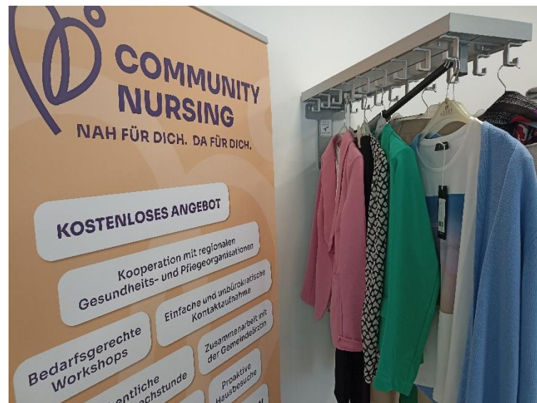
Abbildung 4 und 5: Community-Plauder-Café: Motto „Mode im Alter – Tipps und Tricks“