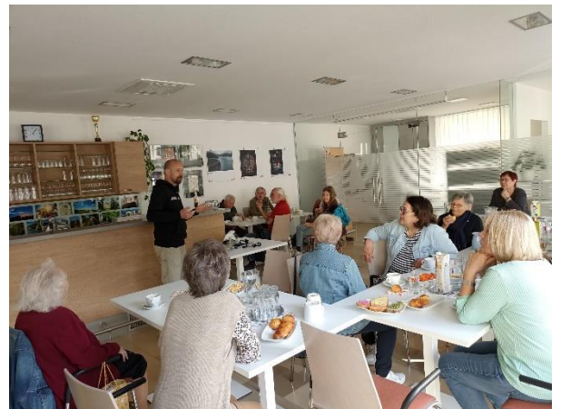
Abbildung 2 und 3: Community-Plauder-Café: Motto „Schnarchen-was tun?“